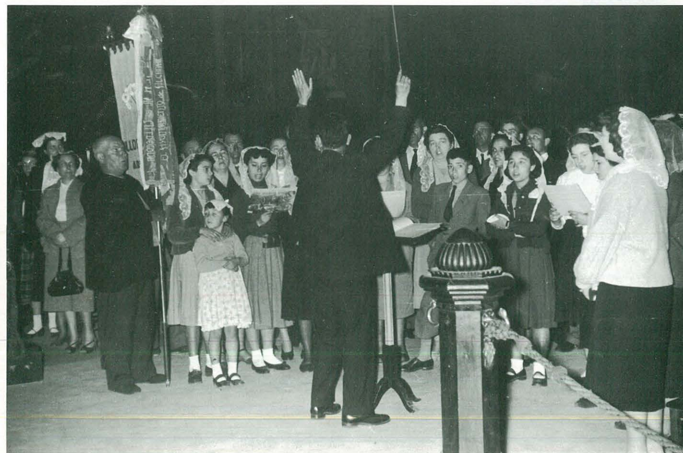
Concert de l'Orfeó Ulldeconenc a Madrid. Any 1955